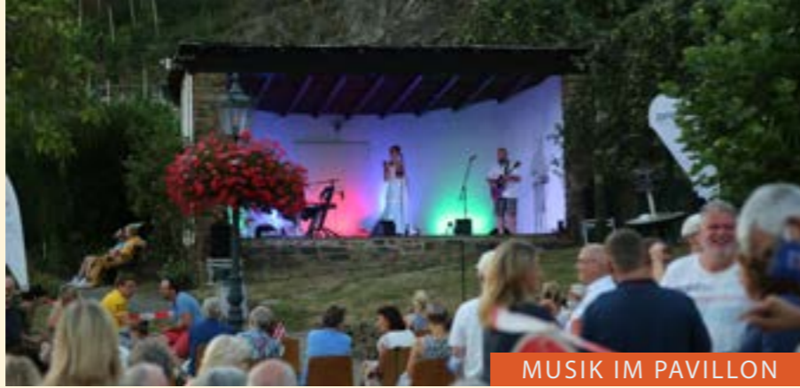
MUSIK IM PAVILLON