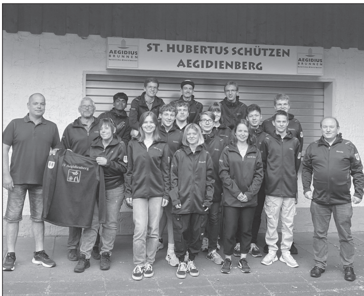
Die Schützenjugend mit neuen Jacken der Firma Kfz Krüschet