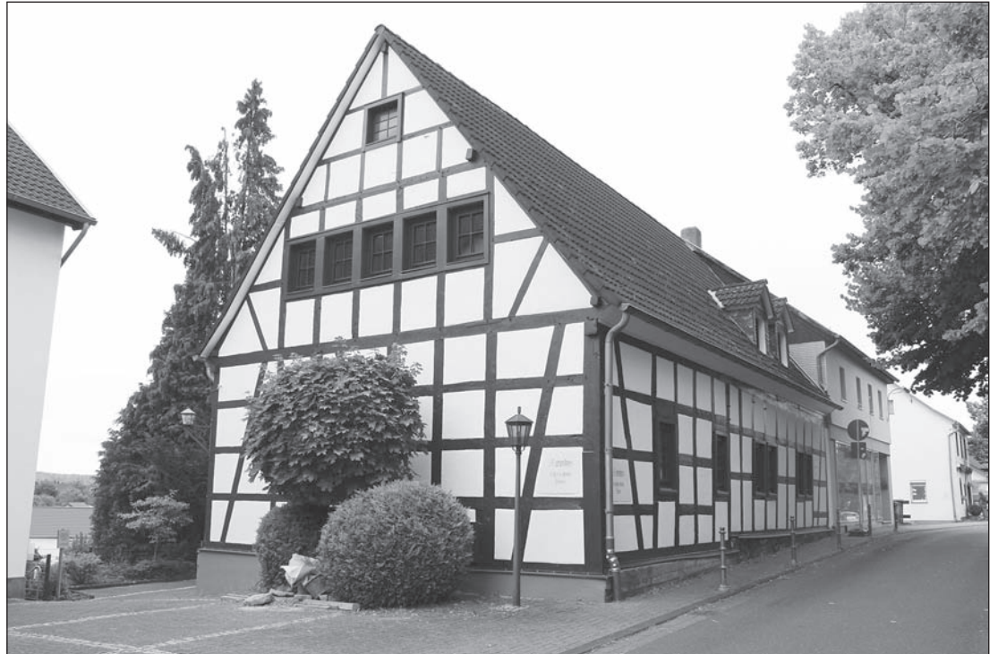
Marienhaus erstrahlt in neuem Glanz.

Wer in den letzten Tagen einmal aufmerksam an Kirche, Marienhaus und Pfarrhaus vorbeispaziert ist, dem ist sicherlich nach Abbau der Baugerüste aufgefallen, dass nicht nur die Kirchenmauer an einigen Stellen saniert wurde, sondern auch das Marienhaus hier wieder im neuem Fachwerkglanz erstrahlt. Mit einem Aufwand von ca. 15.000 EUR hat der Bauverein am Marienhaus sowohl das Fachwerkensemble farblich „aufpoliert“ als auch die Fenster an der Südseite repariert und gestrichen. Auch die Garagen profitierten von der Maßnahme durch einen neuen Anstrich. So hat sich mal wieder bestätigt, dass alleine mit finanzieller Hilfe des Bauvereins für das Marienhaus, -auch ohne gestrichene Mittel aus dem „Aegidius-Pfarrtopf“ des Kölner Erzbistums-, viel bewegt werden kann. Die Heizung konnte vor über einem Jahr auch aus Mitteln des Vereins, Dank der vielen zahlenden Mitgliedern sowie der eingegangenen Spenden saniert werden. Damit hat sich die alte Praxis „he om Berch“ mal wieder bewahrt: „Wenn Jillienberjer wie eene Mann un Frau zesam-