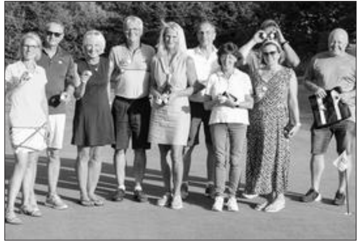
Die erfolgreichsten Golfer des Benefizturniers zugunsten der Kinder Krebshilfe im Golfclub Waldbrunnen

Die letzte Juli-Woche stand beim Golfclub Waldbrunnen ganz im Zeichen der Krebshilfe und der Krebsvorsorge. Gleich drei Benefizturniere mit unterschiedlichen Zielgruppen