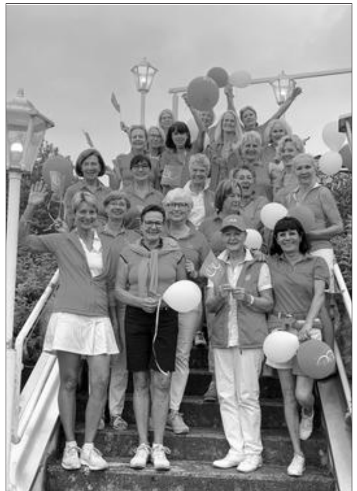
„Pretty in Pink“ für den guten Zweck: Das Teilnehmerfeld des Benefizturniers „Pink Ribbon“ im Golfclub Waldbrunnen

fanden statt, um Gelder für den guten Zweck zu sammeln. Den Anfang machten die Damen des Golfclub Waldbrunnen. In Zusammenarbeit mit der Organisation „Pink Ribbon“ ging es um