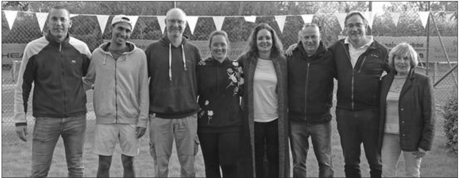
Die Finalisten der Clubmeisterschaft

Auch in diesem Jahr, im Jahr der Jubiläumsfeier "50 Jahre TC Blau-Weiß Aegidienberg", wurden die Clubmeisterschaften im Tennis nach dem gewohnten bewährten Spielmodus ausgetragen: Alle Teilnehmer spielten in der Vorrunde miteinander